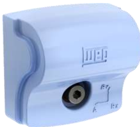
Рис. 1.1: Мотор сканер

Этот документ с общим описанием по сертификатам относится к продуктам WEG Motor Scan® (мотор сканер) и шлюз Cassia X1000.