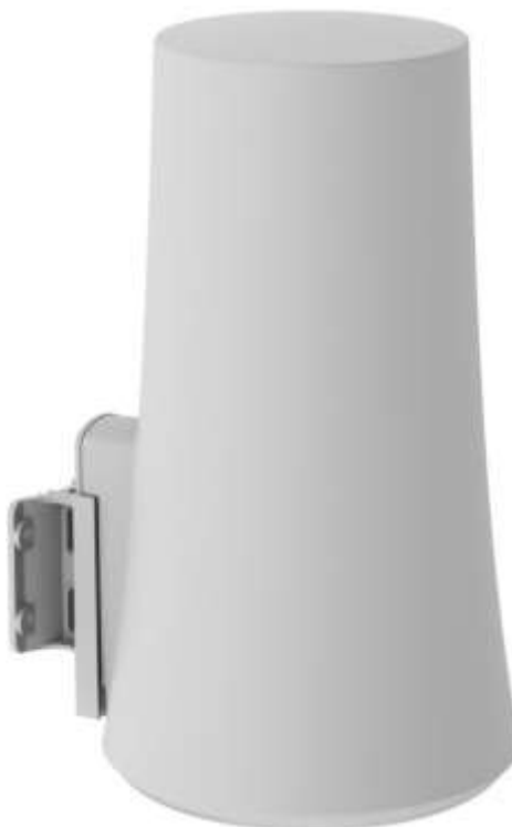
Рис. 1.2: шлюз